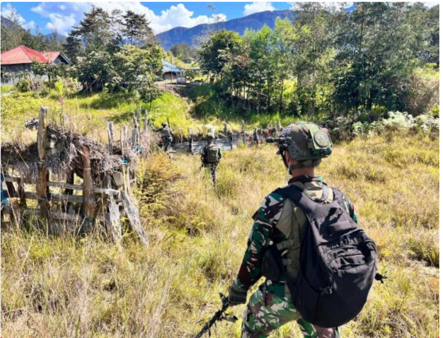
Satgas Mobile Yonif 323 Buaya Putih melaksanakan Patroli Komsos

Satgas Yonif 323 Buaya Putih Kostrad pada saat melaksanakan patroli menjaga keamanan di sektor wilayah tanggungjawabnya di wilayah kampung Gigobak, Distrik Sinak, Kabupaten Puncak, Papua terjadi kontak tembak dan pengejaran terhadap kelompok OPM, Rabu (04/12/24)