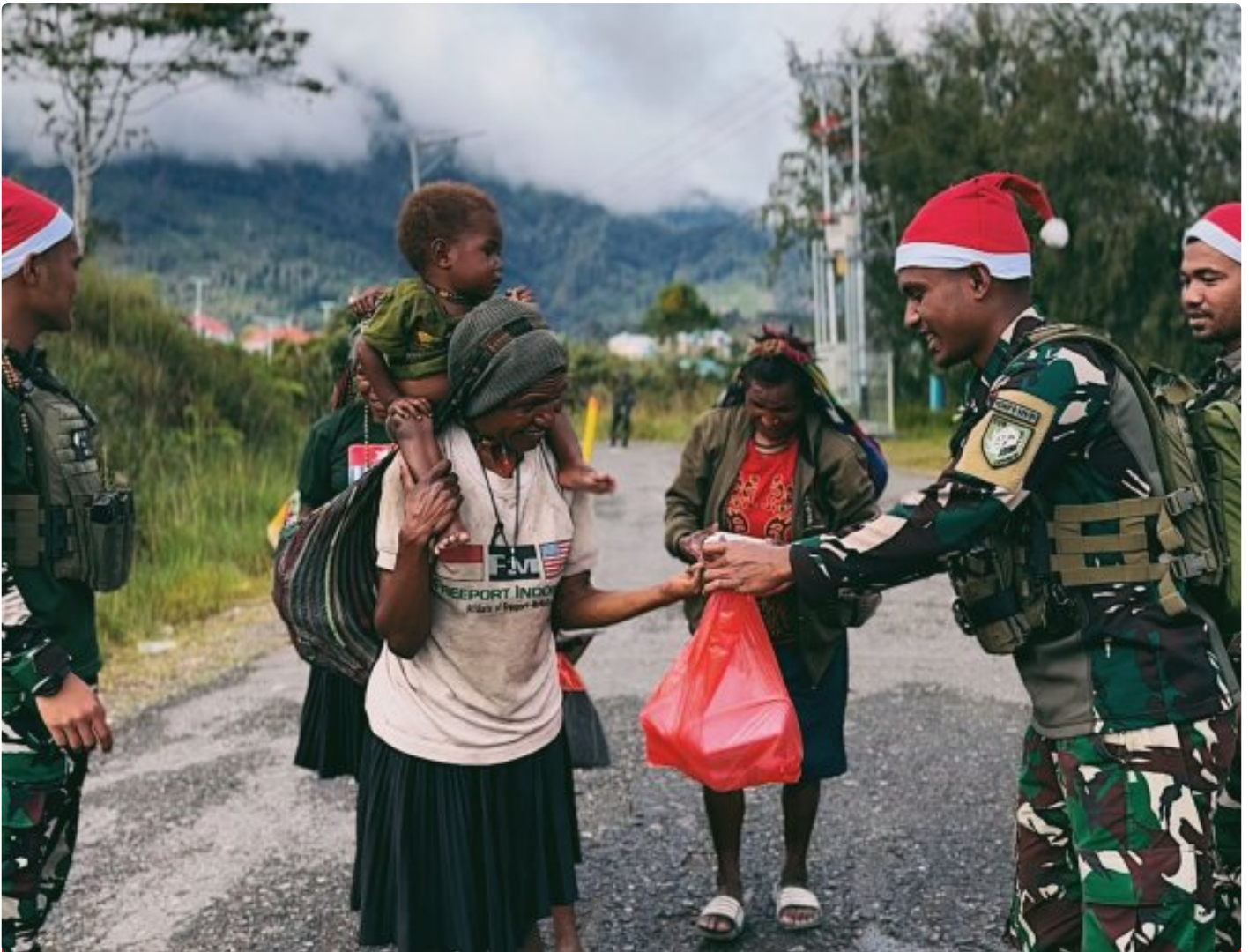
Foto: Satgas Yonif 509 Kostrad memberikan makna baru pada patroli keamanan dengan berbagi kebahagiaan bersama masyarakat di Intan Jaya, Papua.

PAPUA- Dalam balutan semangat Natal yang damai, Satgas Yonif 509 Kostrad