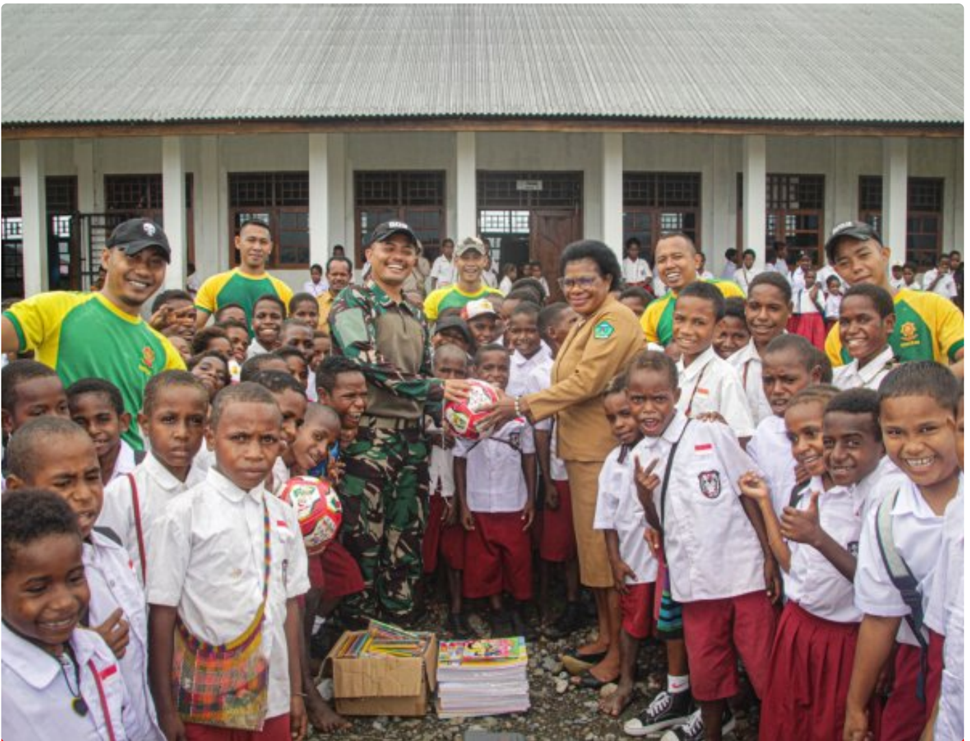
Foto: Satgas Pamtas Mobile RI-PNG Yonif 503/Mayangkara mendistribusikan sarana belajar ke SD Gabungan Distrik Kenyam, Kabupaten Nduga, Papua, pada Minggu (09/02/2025).

NDUGA- Dalam upaya mendukung pendidikan di daerah perbatasan, Satgas Pamtas Mobile RI-PNG Yonif 503/Mayangkara